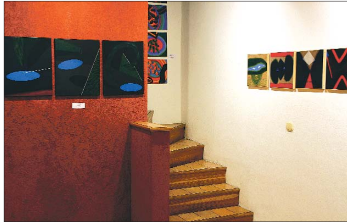
A MissionArt belső tere

egyedülálló katalógusok, ismeretterjesztő anyagok kiadásával indult az akció, hogy azután megjelenjenek egy pártját ritkító kollekcióval, előbb hazai kiállítóteremben, majd külföldön is. A Magyar Nemzeti Galériával és a müncheni Haus der Kunsttal közösen rendezett kiállítás Mattis Teutsch és a Der Blaue Reiter címet viselte – e párhuzammal külön hangsúlyt kapott a Nyugaton kevésbé ismert, itthon pedig kissé elfelejtett magyar avantgárd mester alkotásainak egyenrangúsága a legnagyobb európai kortársakéval. Ha nem is a teljes Mattis-válogatással , de az ő művei középpontba állításával, megjelentek Los Angelesben, Berlinben, Stuttgartban is egy magyar avantgárdot népszerűsítő tárlattal.