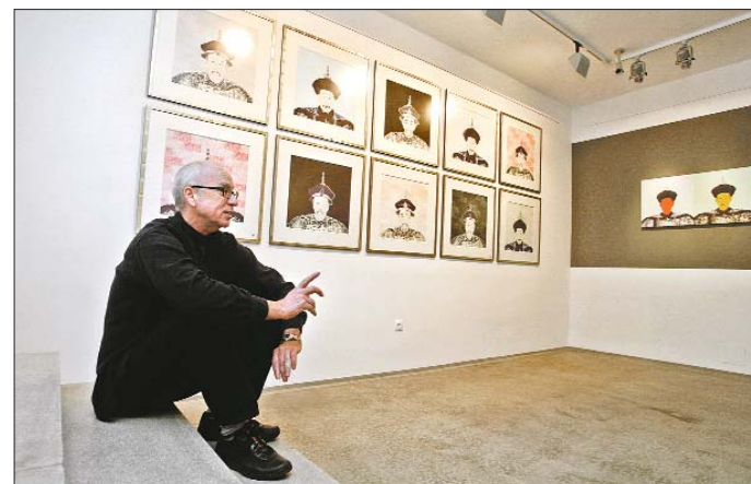
Havadtóty a képei között