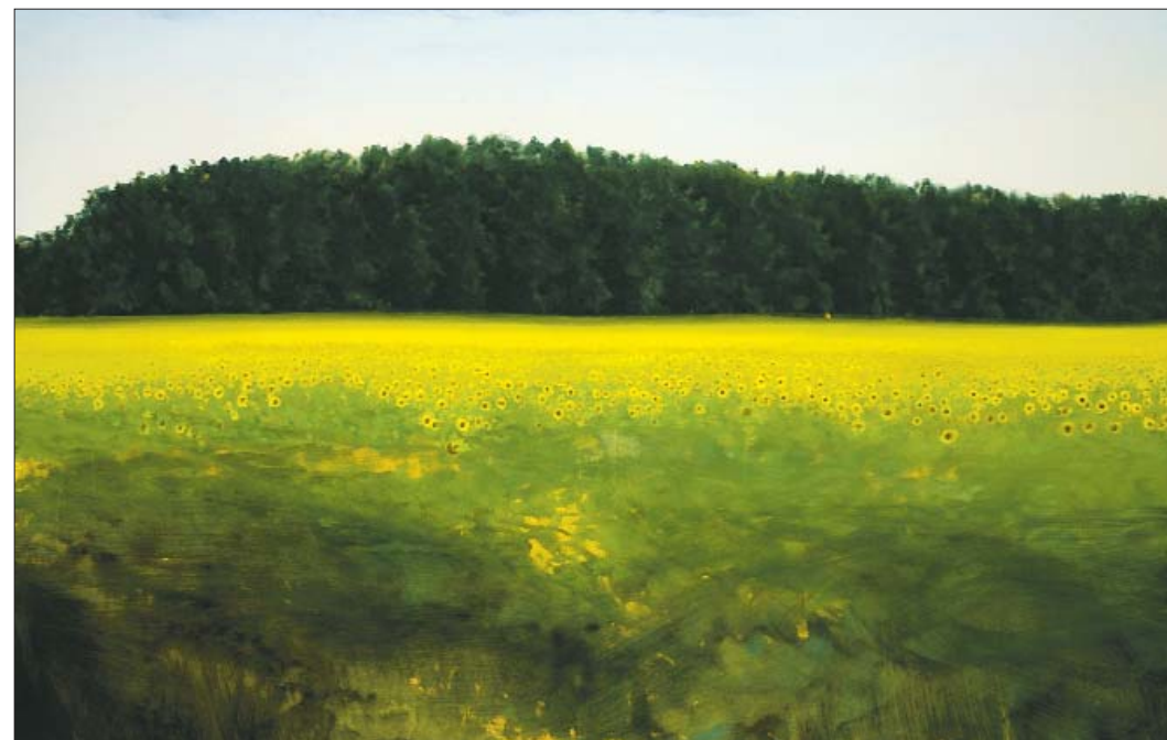
Kovács Lehel: Táj