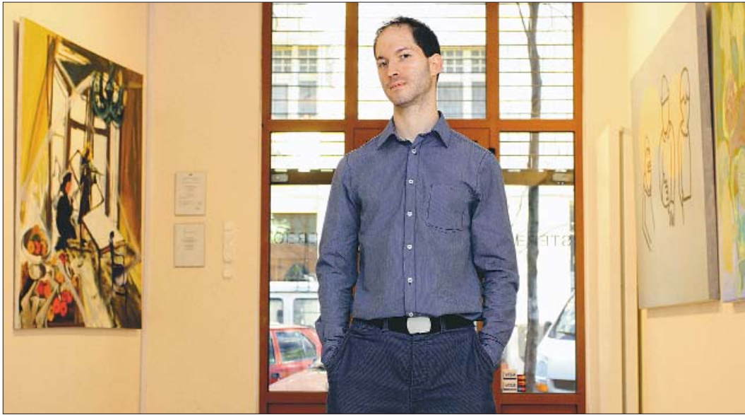
Van már fogadókészség a Mezei Tamás galériájában kiállított „pimasz” művek iránt