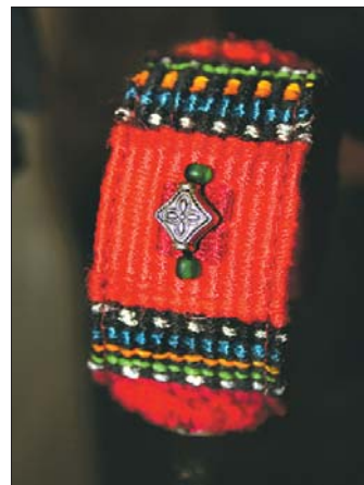
A Stoll'art kollekcójából