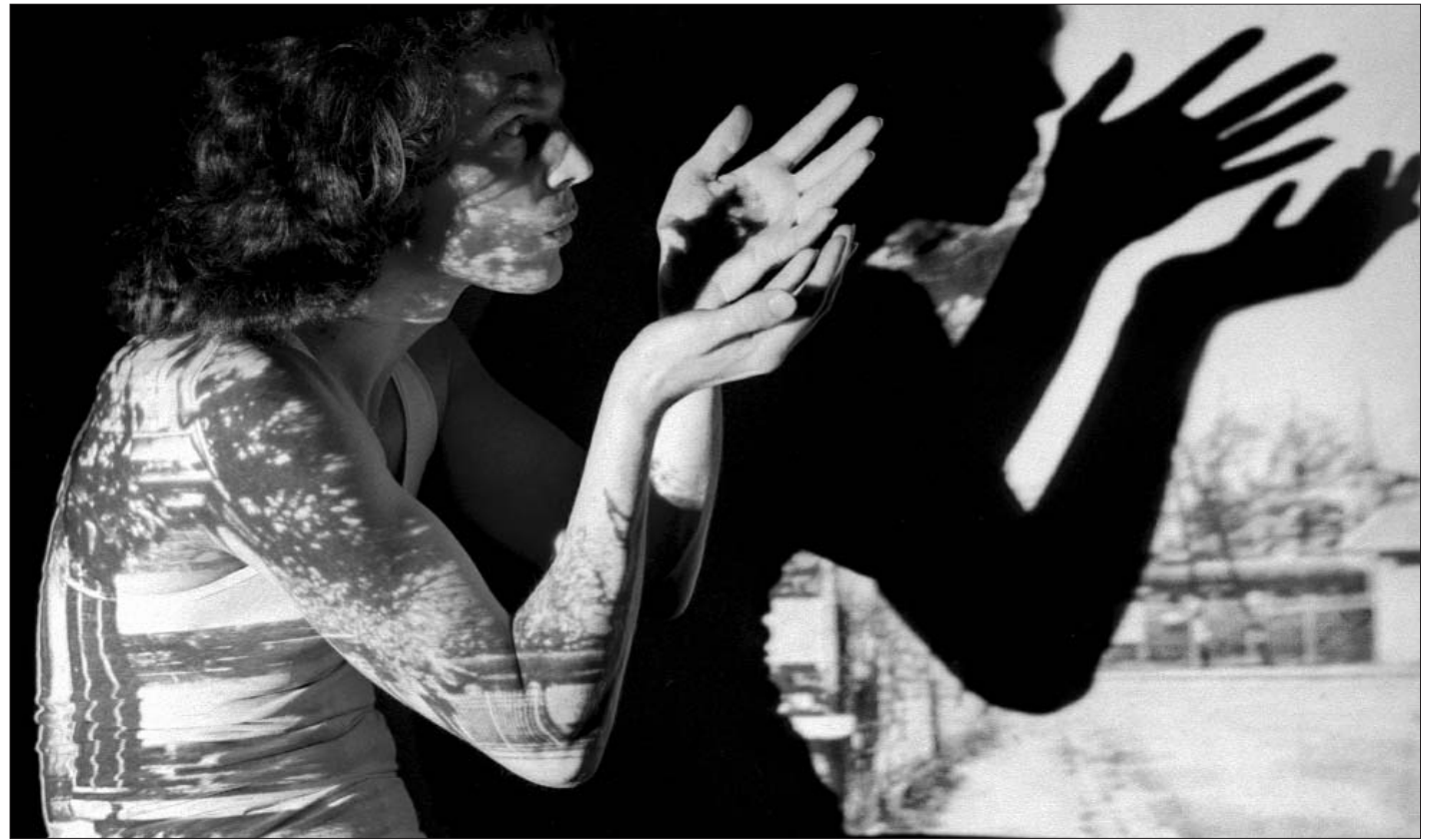
Kelemen Károly munkája