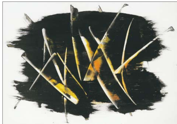
Reigl Judit: Tömbírás, 1959-1960, 145x198 cm

• Erdész & Maklár Fine Arts aukció 2008. december 9., 17 óra, Néprajzi Múzeum